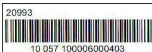
Obrázek 2 - Vzor kódu listovní zásilky